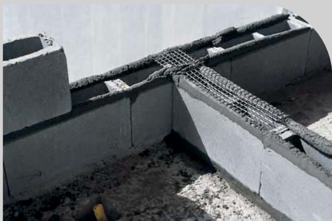
Amarração entre Alvenarias

Telas para Reforço de argamassas são telas soldadas produzidas com fio de 1,20