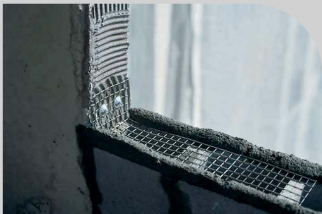
Ligação da Estrutura com a Alvenaria